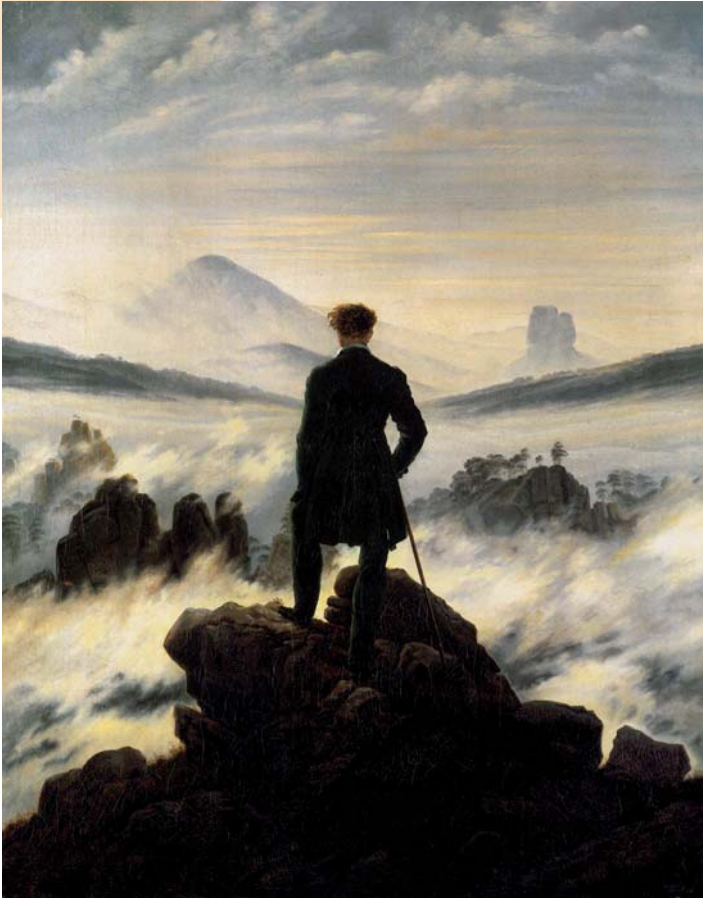
"Wanderer über dem Nebelmeer", Caspar David Friedrich

Avec le soutien du Conseil Scientifique et du Service des Relations Internationales